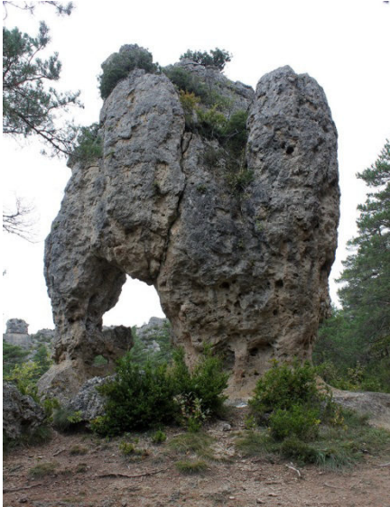
L'arc de triomphe

Montpellier le Vieux, sur le Causse Noir, chaos ruiniforme dans le calcaire dolomitique du jurassique moyen.