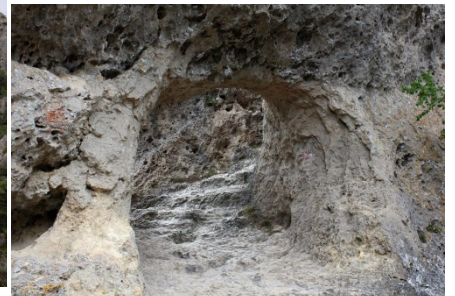
La poterne (ça sent le retour...)

Voilà, c'est presque fini pour cette semaine conviviale sur les Grands Causses, il ne reste plus qu'à ramener une partie de la troupe à la gare de Millau et à prendre le chemin du retour.