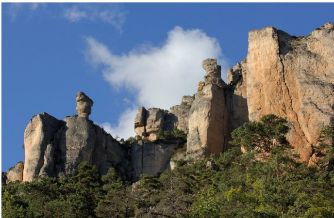
Vase de Sèvres et vase de Chine