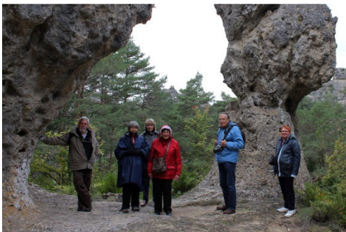
Sous l'arc de triomphe, les mêmes...ou presque