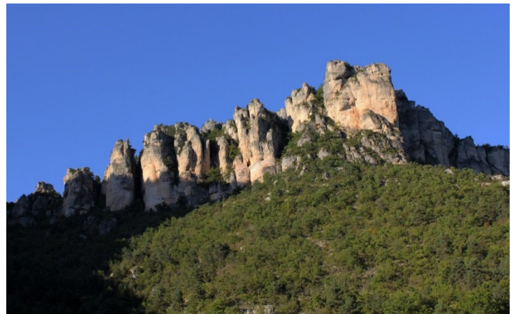
Au niveau de la maison des vautours