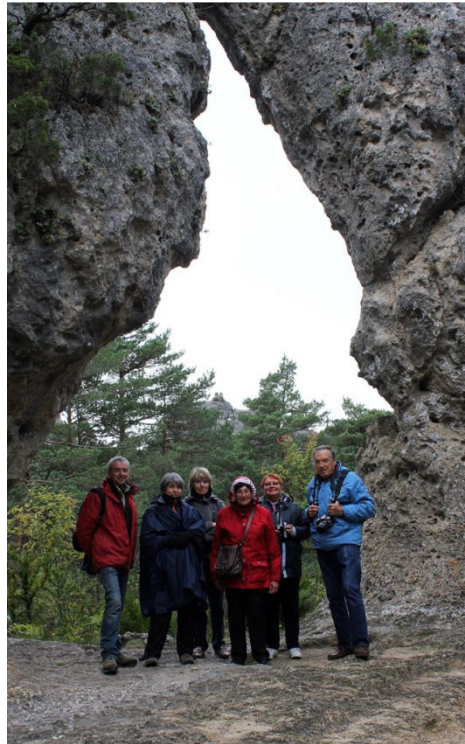
Les étoiles...à l'arc de triomphe