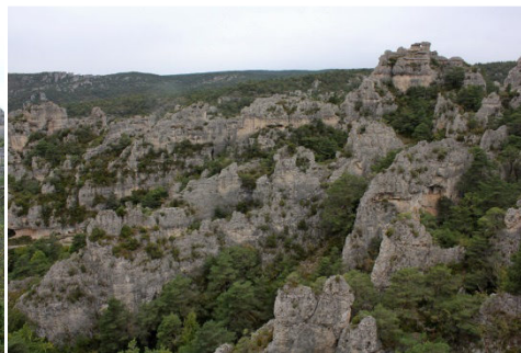
Chaos dominant la Dourbie