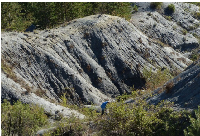
La solitude du fouilleur de fond