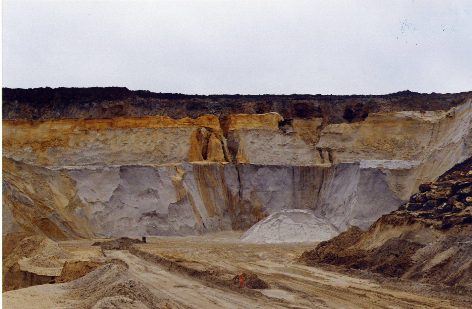
Eure et Loir Environs d'Épernon sablière