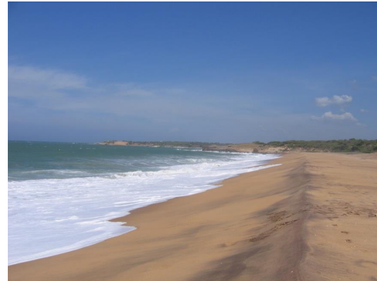
Plage de Palatupani