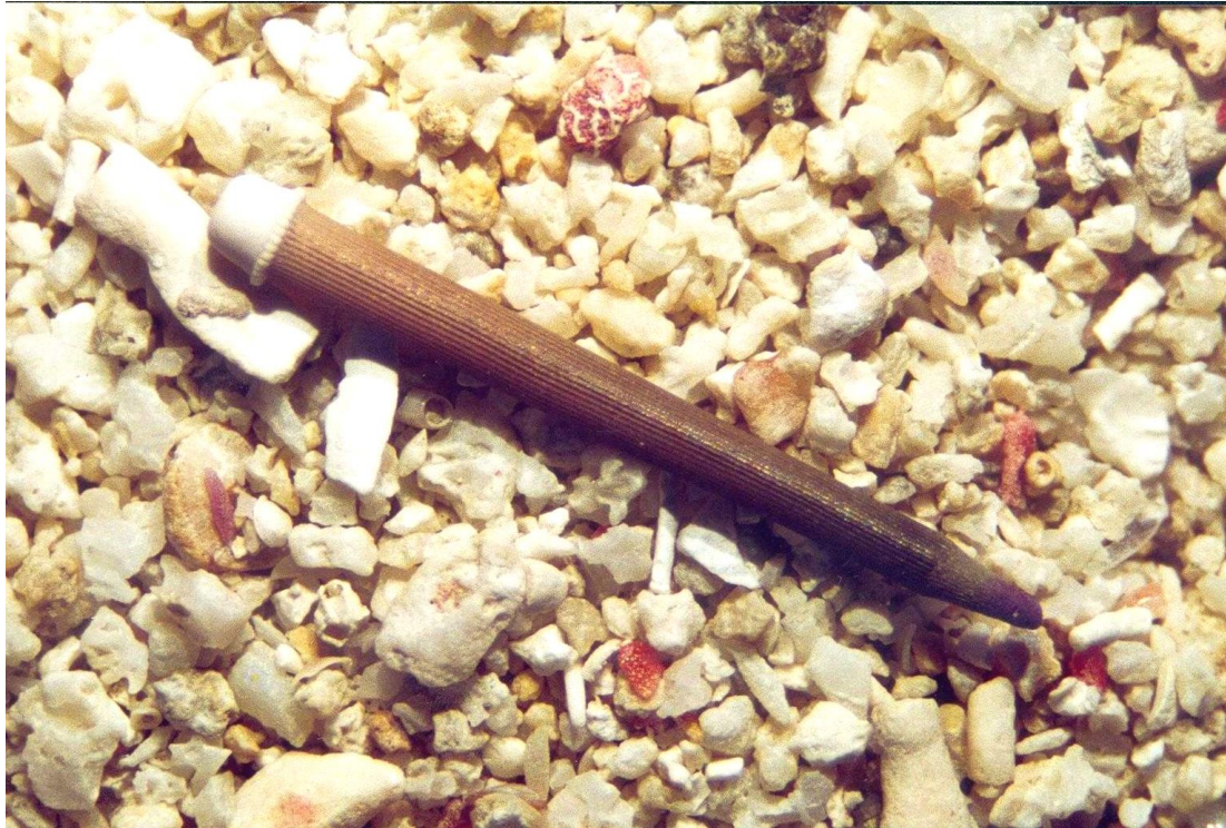
Radiole d'oursin crayon sur sable détritique