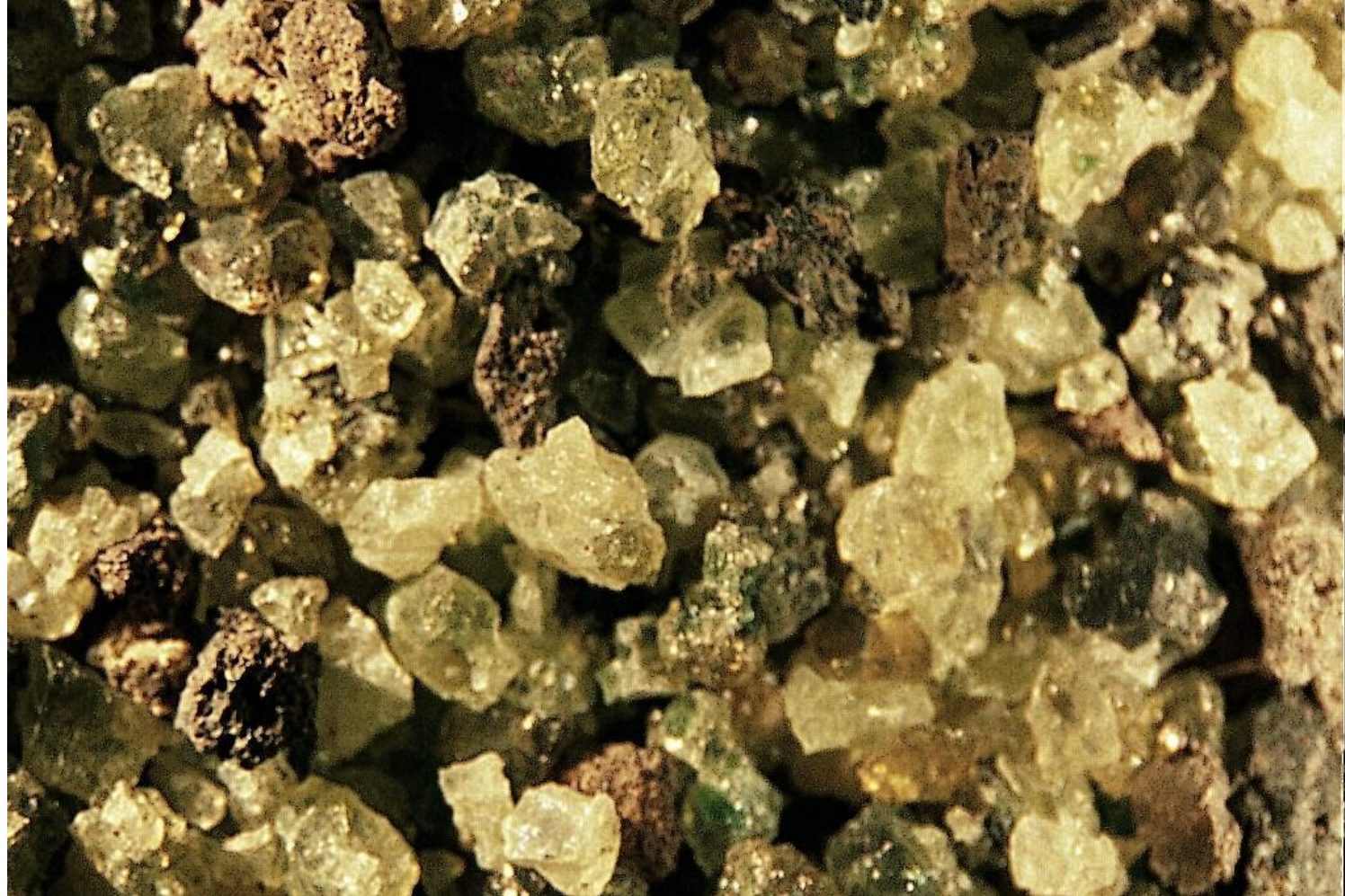
Haute Loire Langeac carrière à Pouzzolanes et péridots