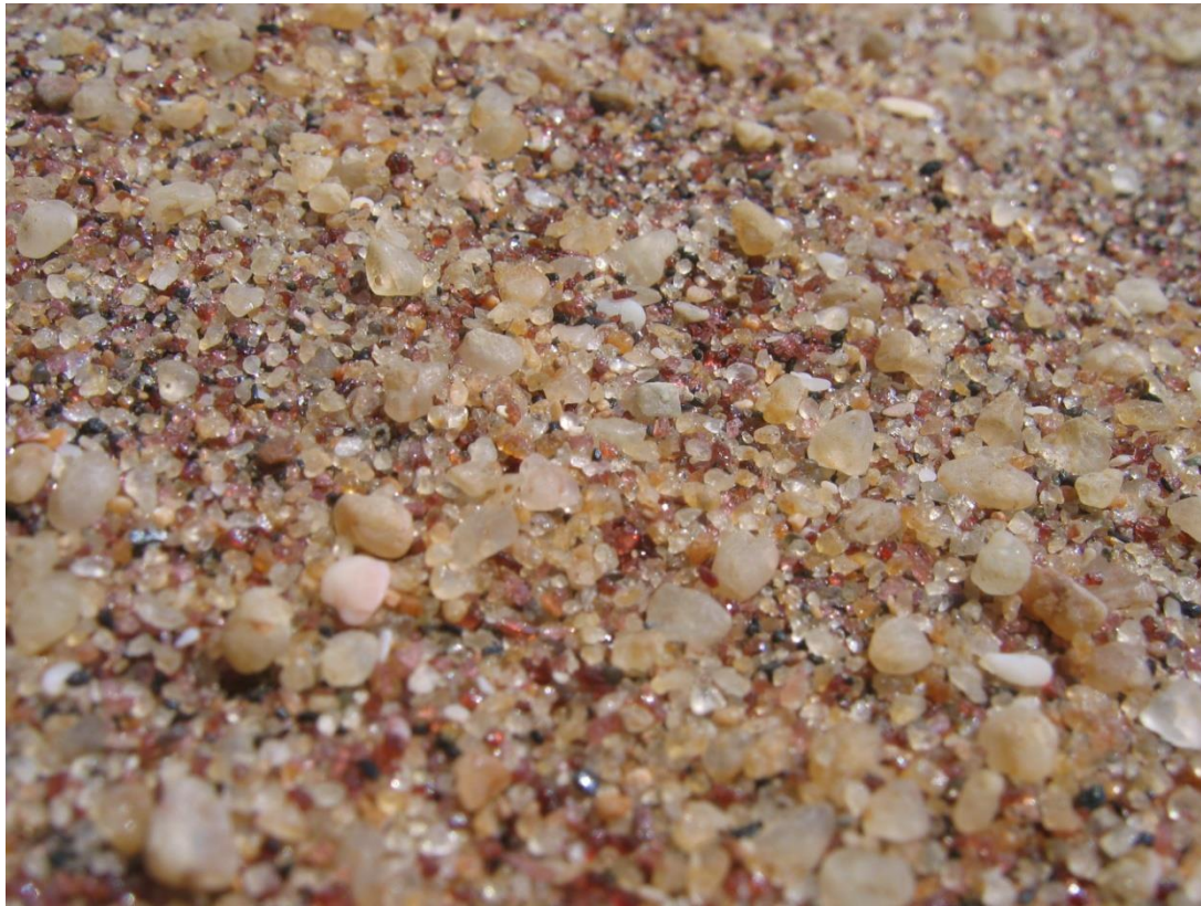
Palatupani grenats