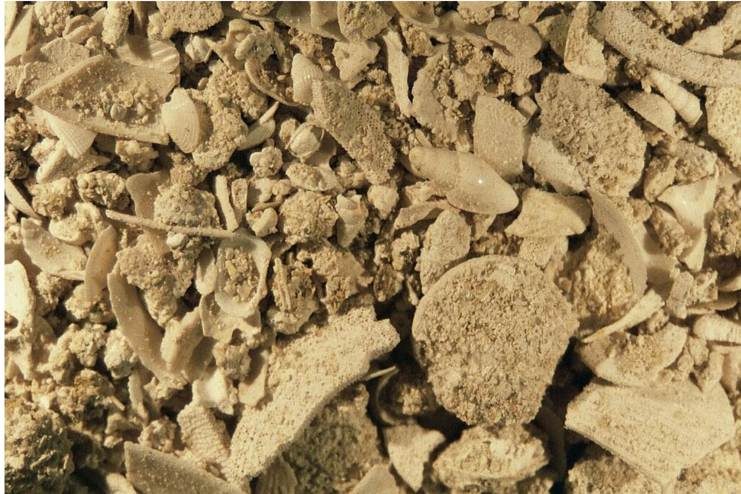
Grignon zone 8-9 faluns - Photo Maryse Le Gal