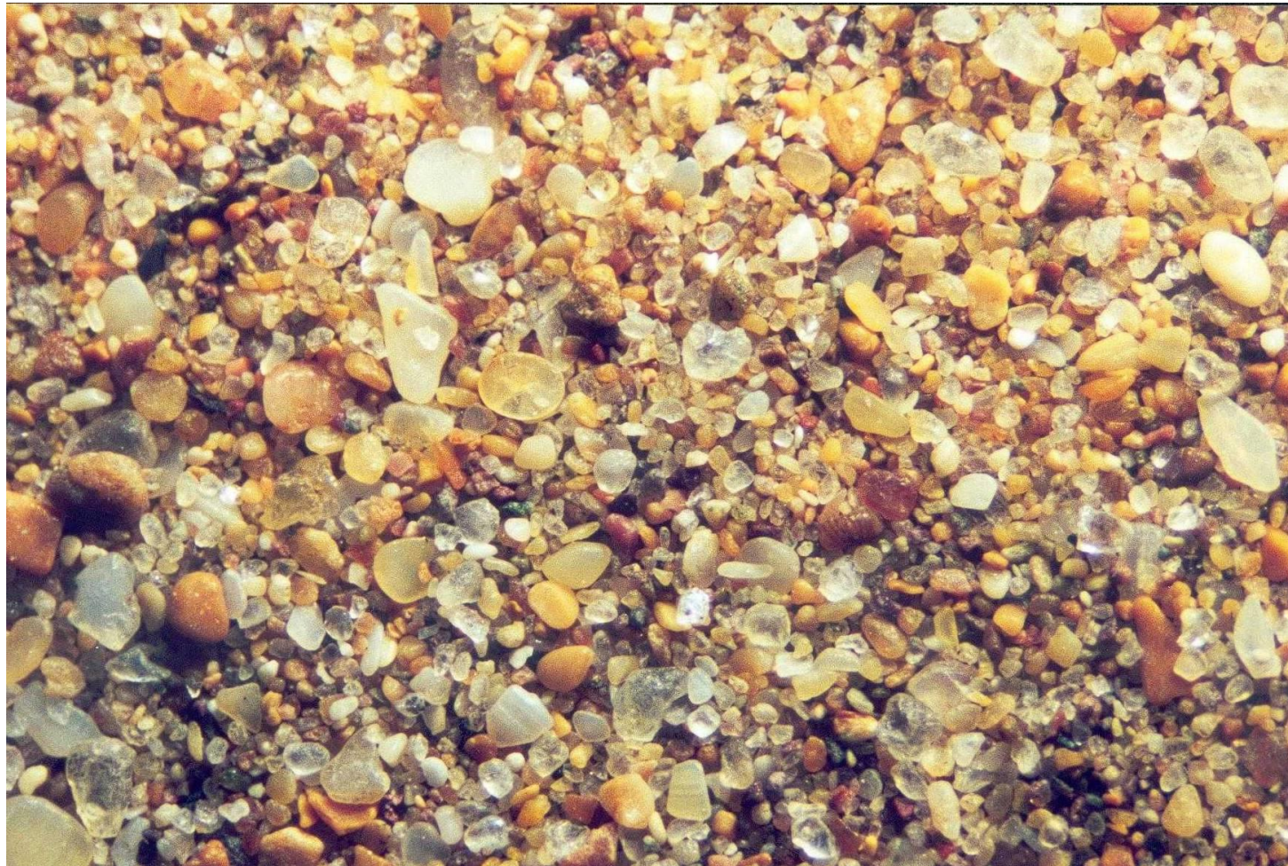
Les Canaries Tenerife Plage de Las Teresitas avril 2000