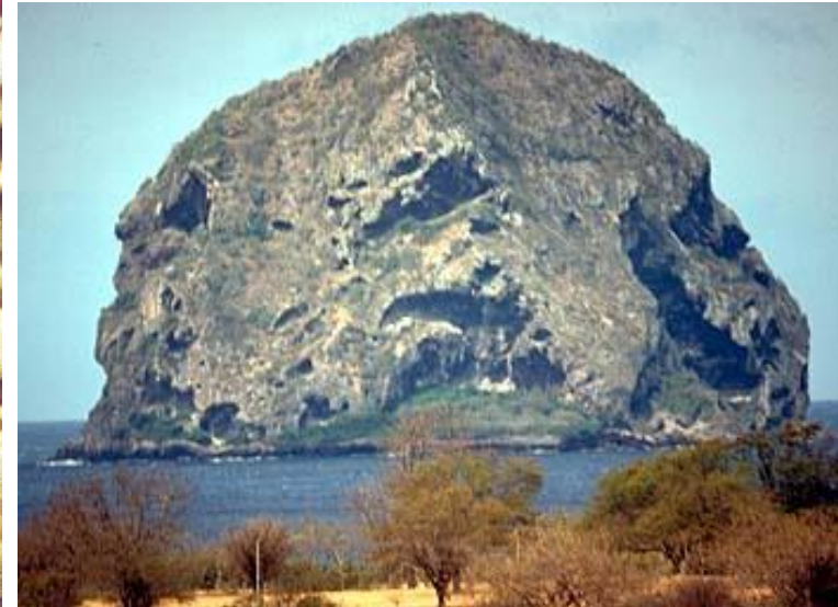
Le Diamant

Ce sable, recueilli en plongée au cours de l'année 2000, est composé de débris de coraux, de coquillages et de crustacés.