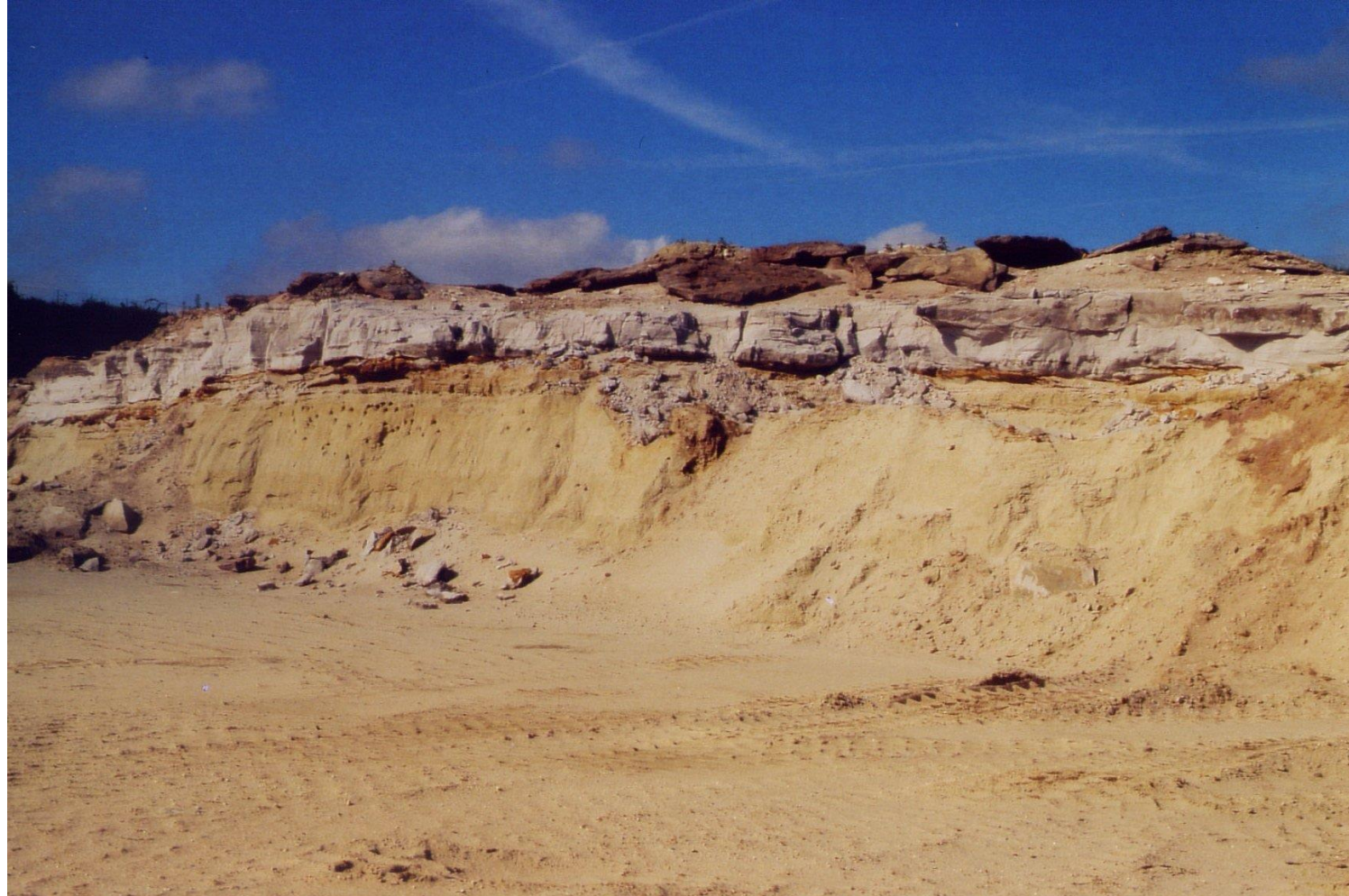
Val d'Oise sablière du Guépelle