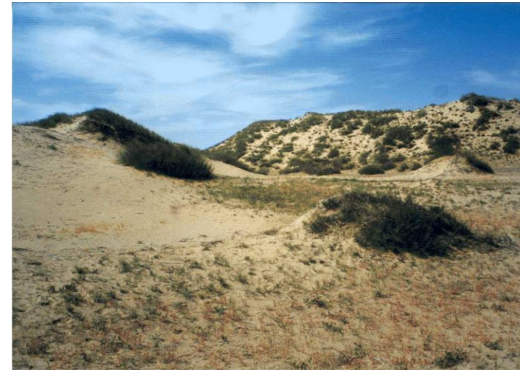
Dunes d'Archangai - Photo Nicole Casile