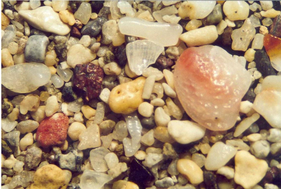
Les Salines