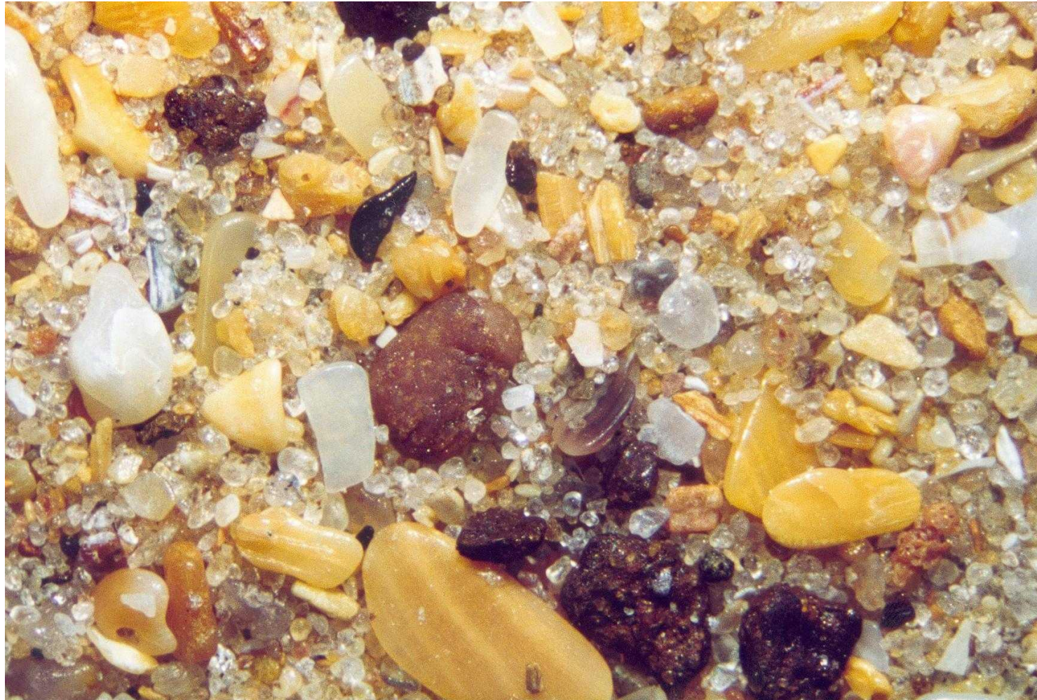
Plage de Mbourg