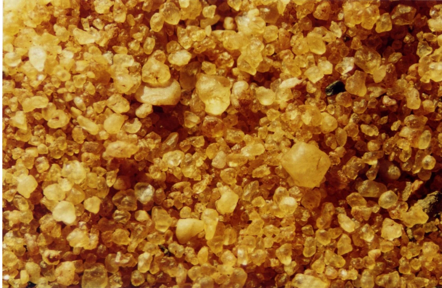
Désert du Kalahari