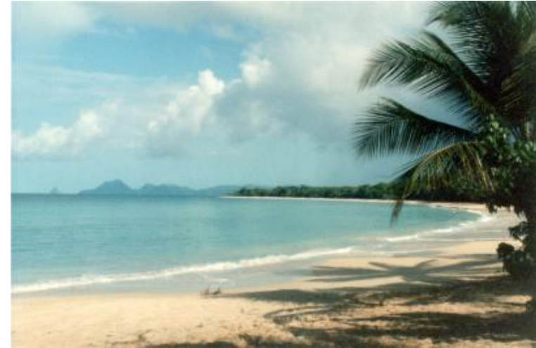
Plage des Salines - Photo Internet