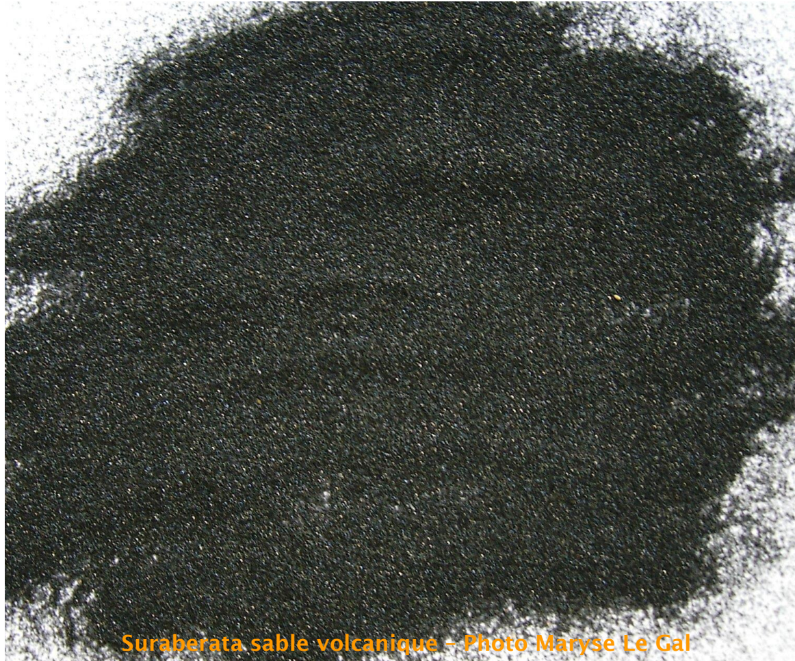
Surabera sable volcanique