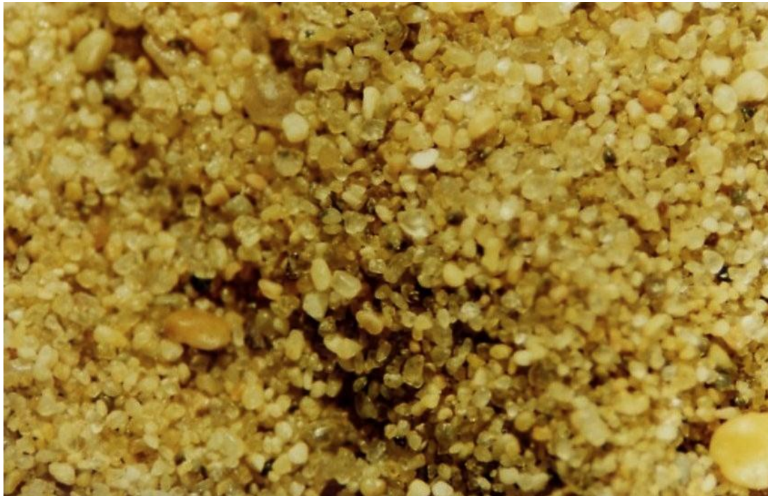
Sable des dunes