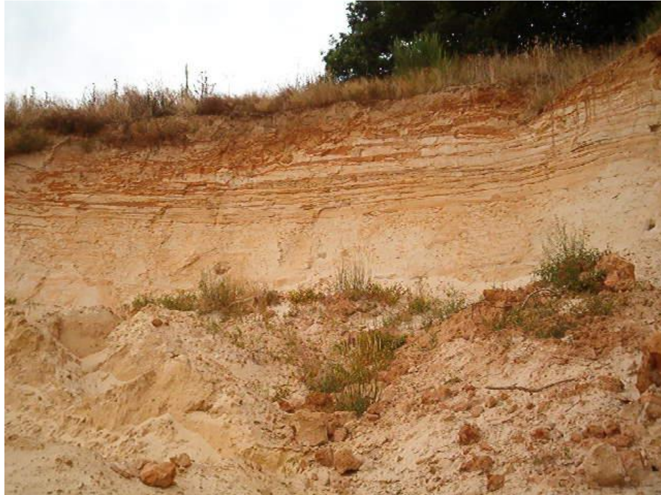
Essonne sablière du Plateau