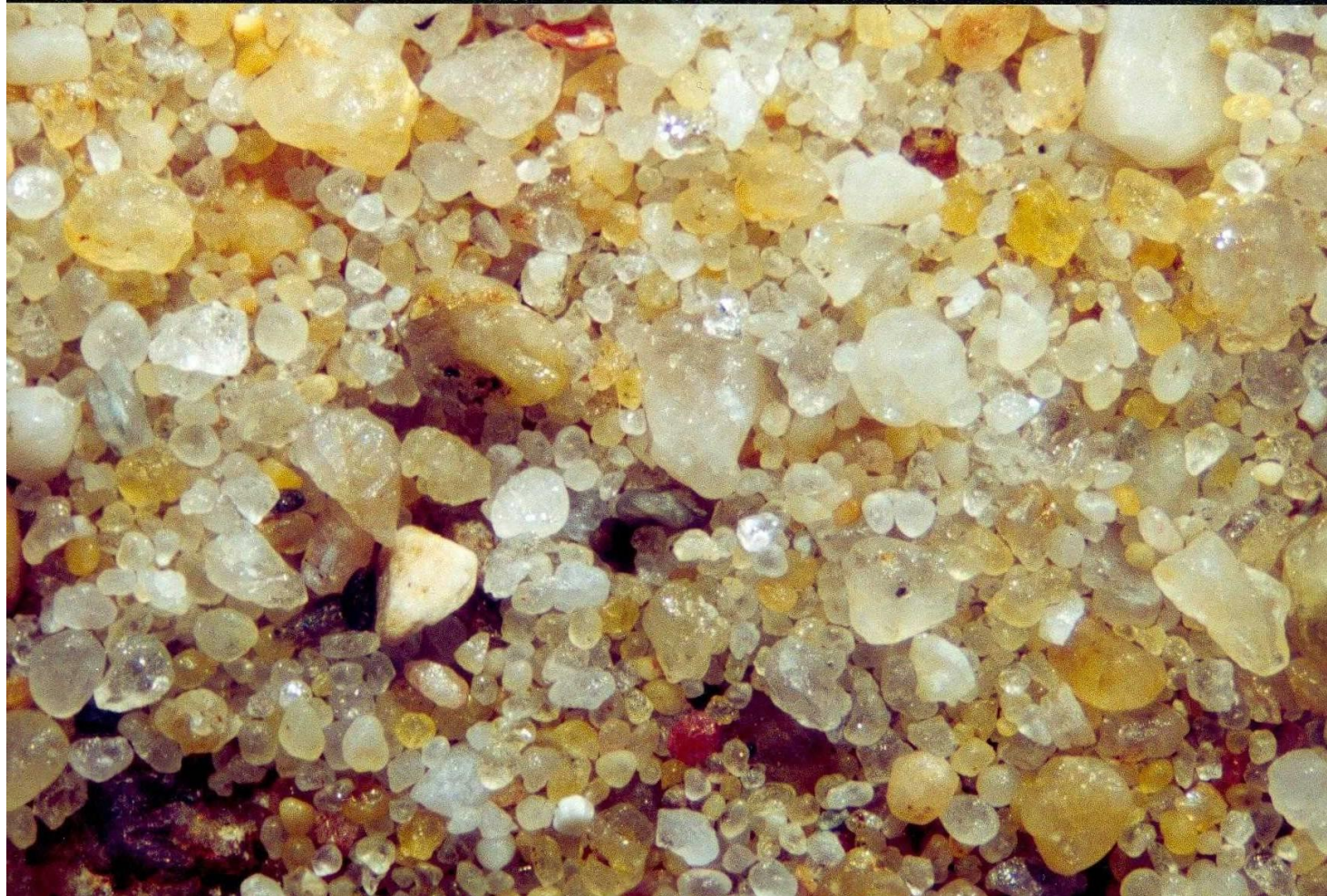
Gironde Hourtin