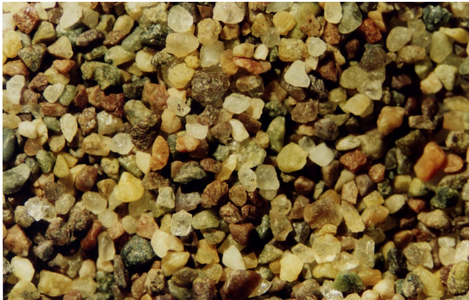
Miquelon Mirande