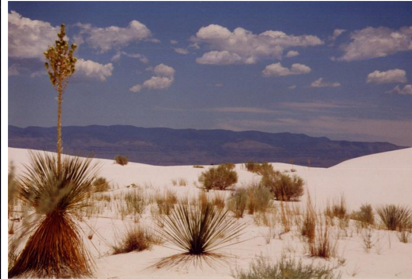
White Sands