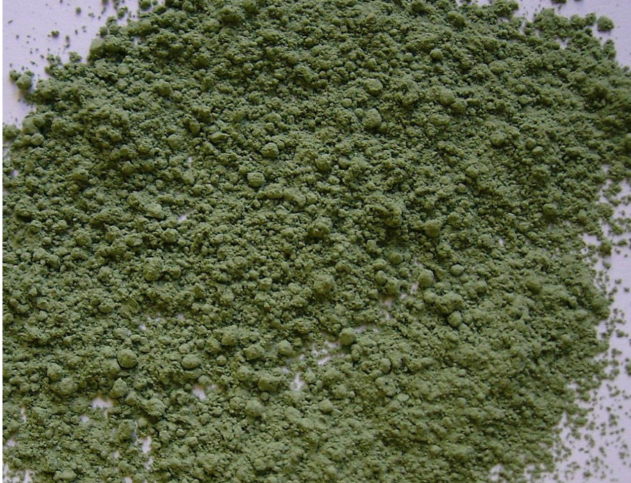
Var Rustel Colorado Provençal - Photo Maryse Le Gal