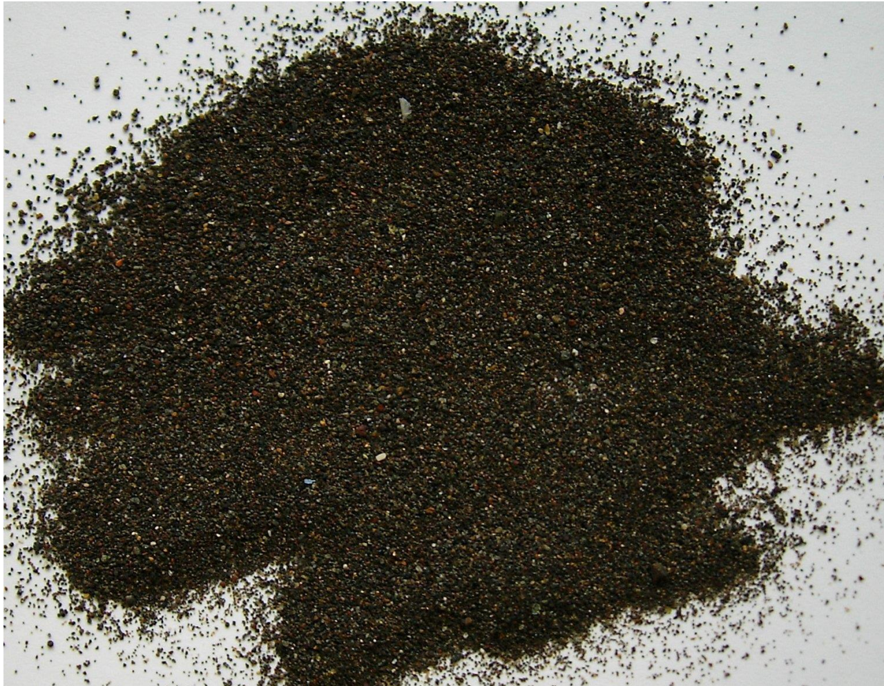
Madère plage de Funchal