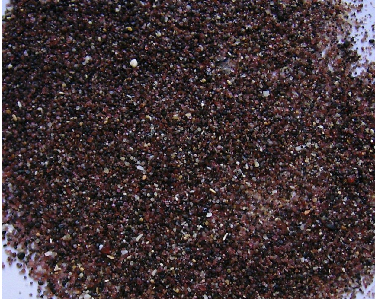
Morbihan Ile de Houat sable à grenats et magnétite