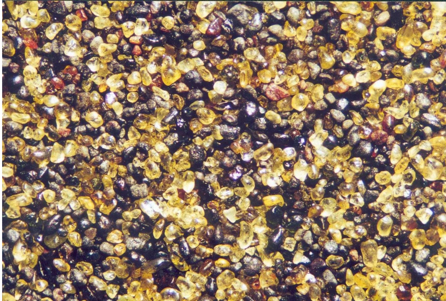
Sable d'Etang Salé