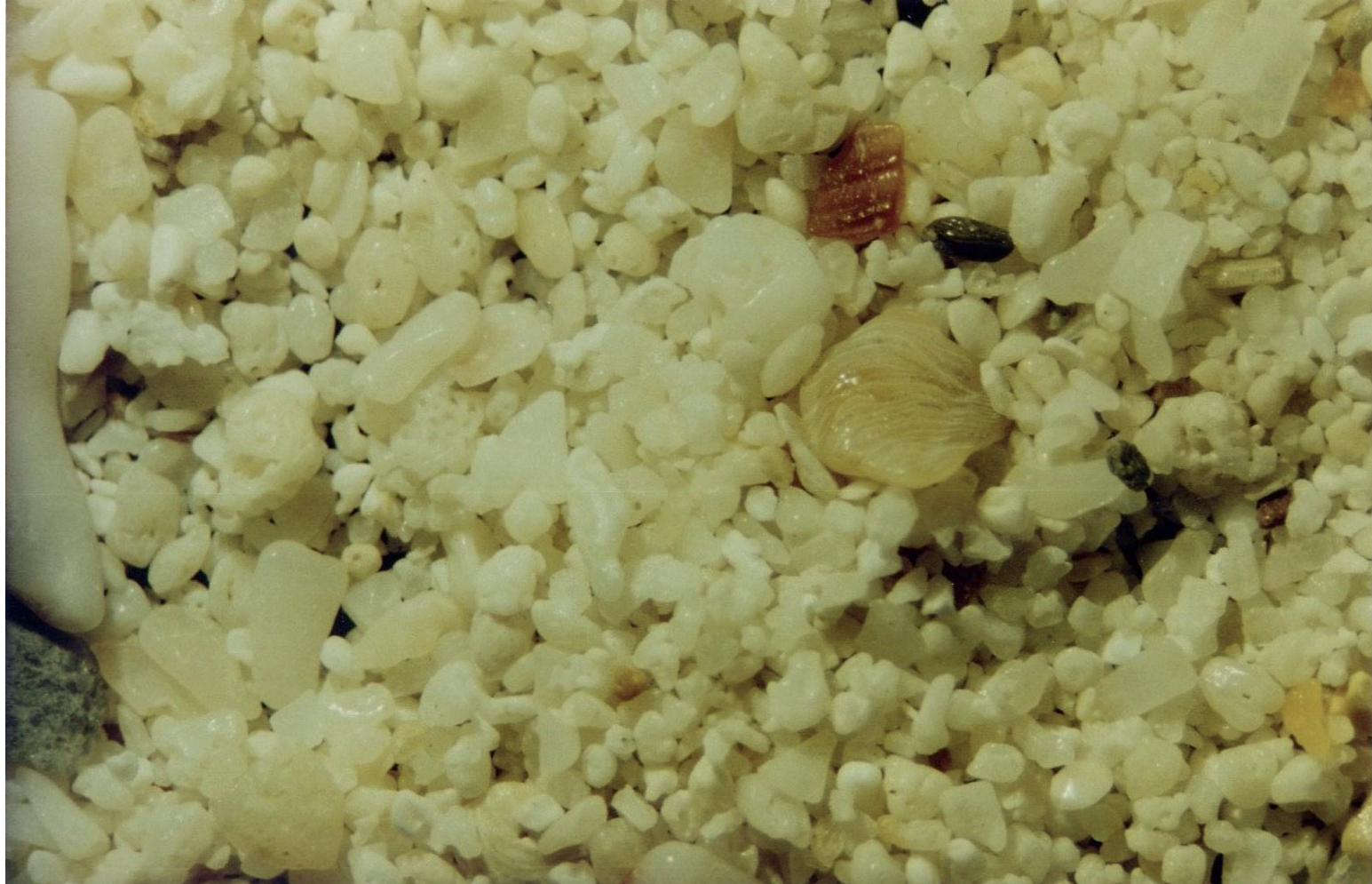
Koh Larn Ile de Corail au Sud de Pattaya