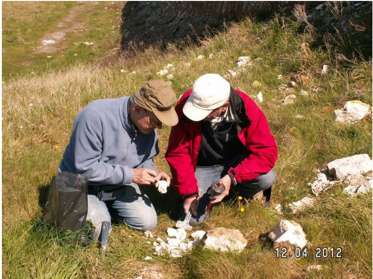
Leskei ou decipiens ?