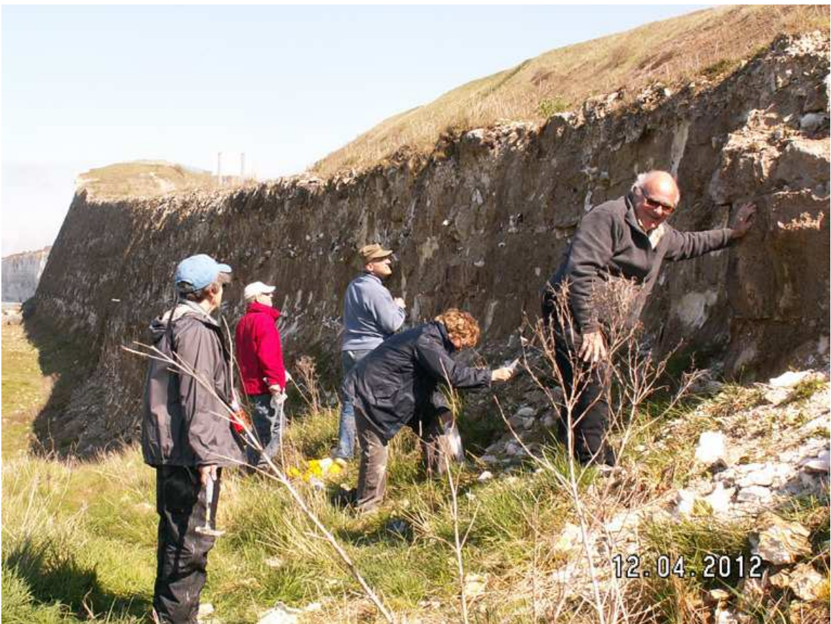
Les oursins n'ont qu'à bien se tenir !