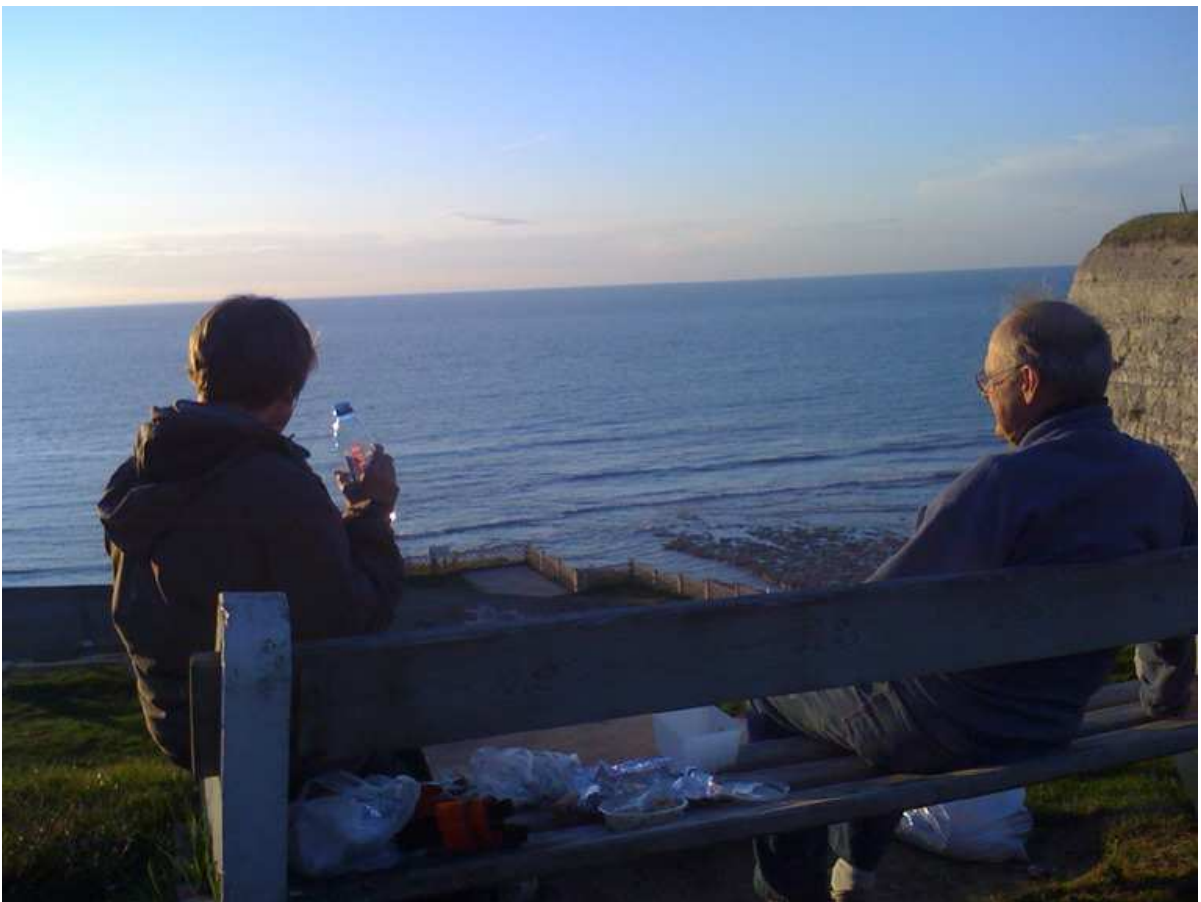
Pic nic vespéral. Moment magique.