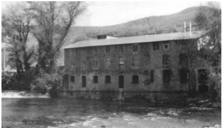
Ancienne mégisserie au bord du Tarn