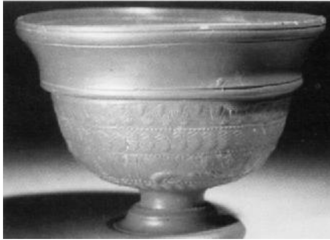
Calice en poterie sigillée, site de la Graufesenque, 1 er siècle après JC