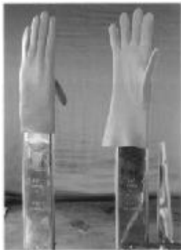
Mains chaudes servant à redonner au gant sa ligne et sa forme